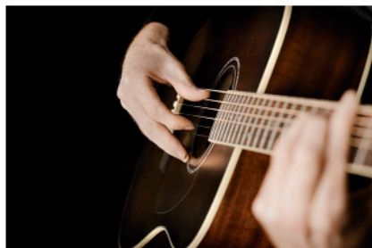
Taller de guitarra clásica y popular