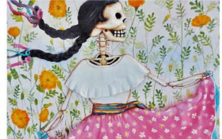
Centro de Lectura del Estado de Querétaro