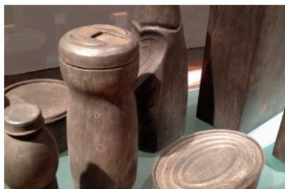
Exposición "La naturaleza y su estado de contingencia"