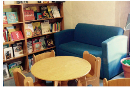
Centro de Lectura del Estado de Querétaro