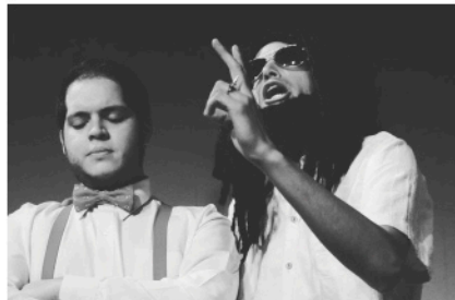
Hombres sin Barrera 2