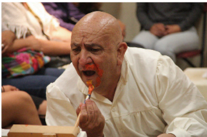
Autorretrato, Yo Van Gogh

Domingo 30 - 12:00 h Coop. $60 Ludoteca El Globo del Espacio Teatral La Cartelera