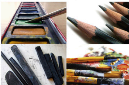
Taller de Pintura Espontánea