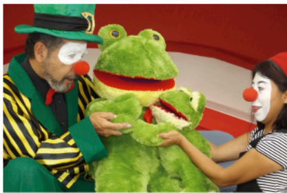
Los dos Pancracios