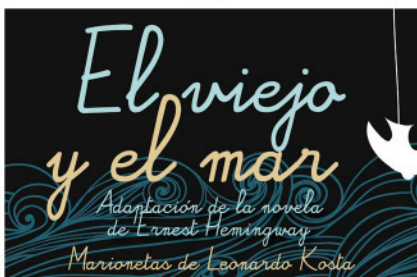
El viejo y la Mar