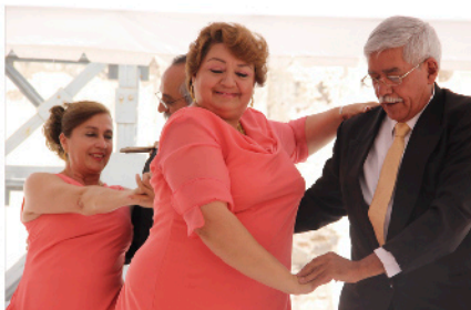
Día Internacional de la Danza