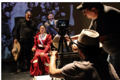
Escuela Libre de Cine

Informes: paideia.agoravirtual@gmail.com C. (442) 145 8120 Facebook: @ELEplataforma www.laplataformacreativa.com