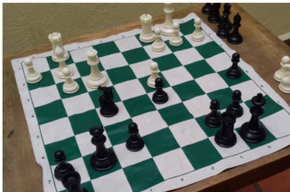
Ajedrez en el Artium

CENTRO DE LECTURA SANTA ROSA DE VITERBO Artega 89, Centro Histórico Informes: centrodelectura.qro@gmail.com