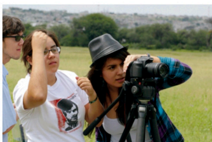
Curso "Apreciación del cine"

Perú/Argentina/ Colombia/España, 2015 De Salvador del Solar