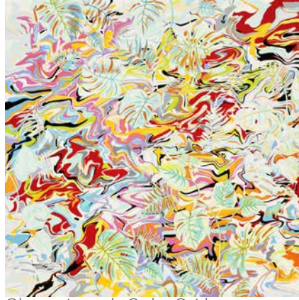
Obra reciente de Carlos Oviedo