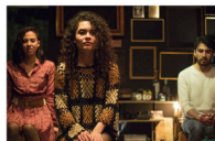
En la ruina de los naufragos

Para las obras "Dios es un bicho" y "La mirada de Alonso" $80 Adultos 2x1 Niños Entrada libre a la función de Fragmentos...que se presenta el jueves 12 en el Centro Cultural Hangar, UAQ Informes: C. (442) 319 5734 www.atalbateatro.com