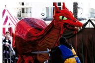
Obra Caballeros y Dragones

Dirección: Horacio Warpola y Juan Manuel Velasco Grupo Cantera (Querétaro) Función: viernes 29 - 20:00 h Museum de la Ciudad