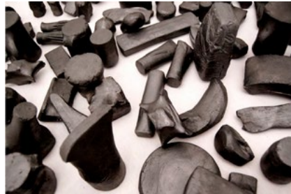
Pie de foto: Eric Bachtold