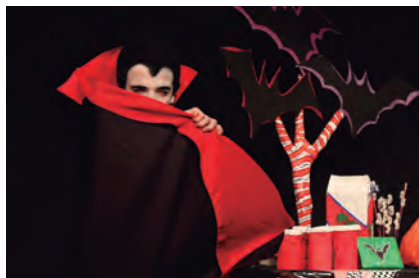
Monstruos buena onda