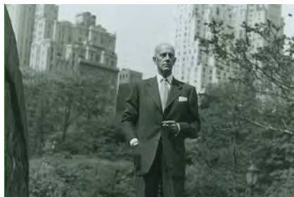
Las noches de Francisco Tario