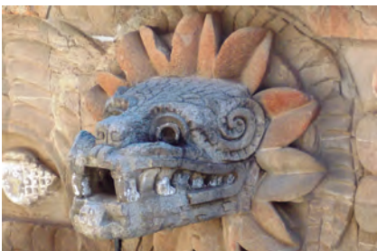
Curso: Arte y historia del México Prehispánico

Escúchalo todos los martes a las 12:00 h Por el 100.3 FM, RTQ Consumo Libre