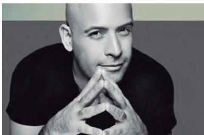
Esto sé. Odin Dupeyron