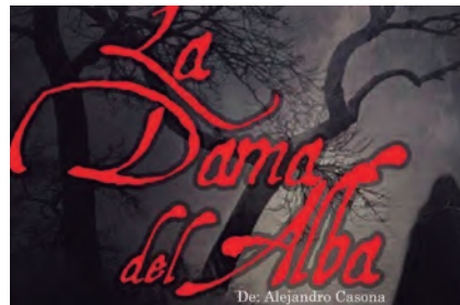
La dama de Alba

Contamos con diferentes talleres artísticos y educativos