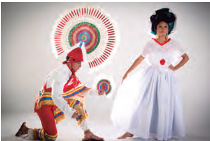
México vestido de Tradición