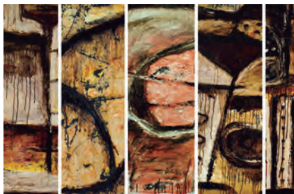
Memorias del Olvido